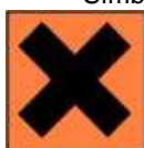
Xn - Nocivo