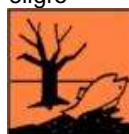
N - Peligroso para el Medioambiente